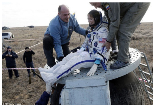
L'astronaute de la NASA Kate Rubins mesure 3.4 cm de plus lors de son retour sur la Terre !

Regardez la photo des astronautes. Ils n'ont pas tous la même taille. Pour information, Paolo Nespoli, l'astronaute italien, est au centre. Selon l'Agence spatiale européenne, Paolo mesure 1,88 m. Il est plus grand que la plupart des astronautes. De nombreuses fonctionnalités dans un vaisseau spatial peuvent être réglés en fonction des astronautes qui les utilisent. Avant chaque vol, les sièges sont ajustés à chaque passager. Et rappelez-vous que les astronautes auront une taille différente à leur retour ! Cela veut dire que le vaisseau spatial et les combinaisons spatiales seront ajustés différemment pour les voyages aller ou retour. Avez-vous remarqué si votre pyjama est ajusté différemment entre le soir (au coucher) et le matin (au lever) ? Examinons cette question ensemble !