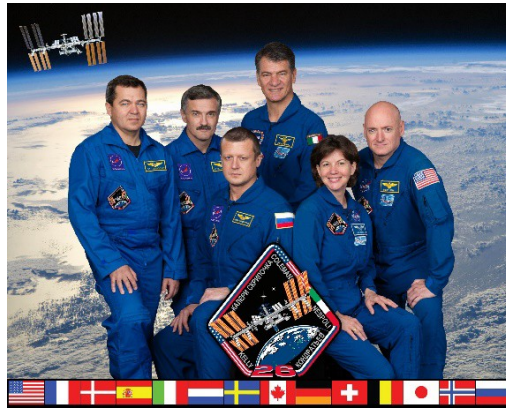
Expédition 26, avec l'astronaute de l'ESA, Paolo Nespoli, au milieu.